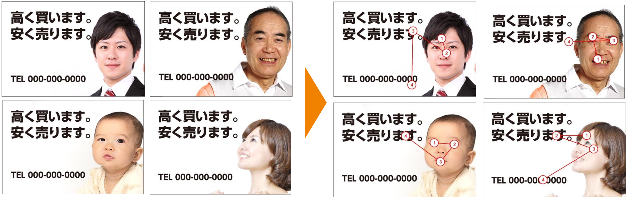
視線トラッキングチャート

見ている人の視線の動きは、(1) 人の顔⇒(2) 犬の顔⇒(3) 文字⇒(4) 人の顔 といった具合に移動しています。